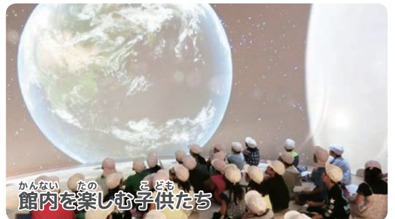
館内を楽しむ子供たち