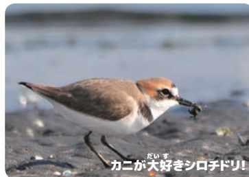
カニが大好きシロチドリ!

シロチドリは三番瀬では一年中観察できる鳥ですが、数は夏場が少なく冬場に多いです。また、オスは冬に夏羽(繁殖羽)になり、前頭部が黒くなるのも特徴です。(大谷)